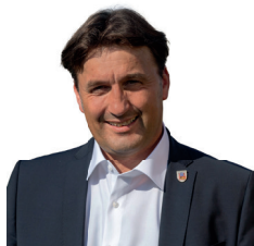
Gerd Dallner, Bürgermeister von Pommersfelden

Allein die Vorfinanzierung der Baukosten stellt für uns Kommunen eine immense Bereicherung dar. Wir müssen nicht – wie sonst üblich – ewig auf Zuschüsse warten.